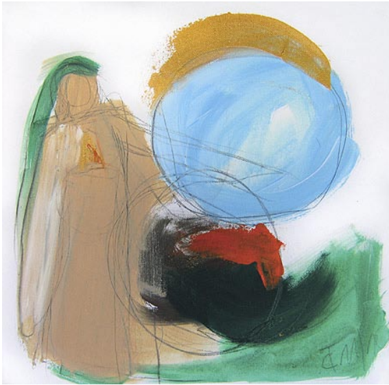
Claudia Tiemann »Movement« Acryl auf Leinwand

„Bilder sind ein Ausdruck der Schöpfungsenergie, die immer wieder Neues gebiert! So auch die Bewegung, der Herabstieg vom Himmel zur Erde.“