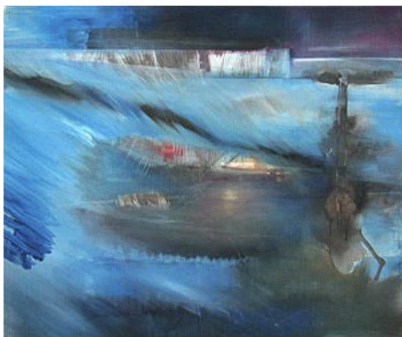
Brigitte van Laar »Im Fluss« Acryl auf Leinwand

„Ich experimentiere, spiele gern mit verschiedenen Techniken, immer bewege ich mich an der Grenze zur Gegenstandslosigkeit.“