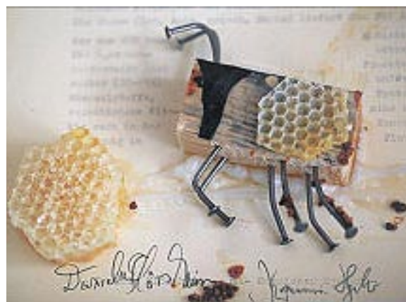
Performance und Bienenkästen „flux flug“