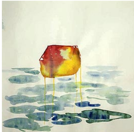
Dagmar Bechhaus aka June Peach »lost & found - walking house« Aquarell

„Bilder sind ein Ausdruck der Schöpfungsenergie, die immer wieder Neues gebiert! So auch die Bewegung, der Herabstieg vom Himmel zur Erde.“