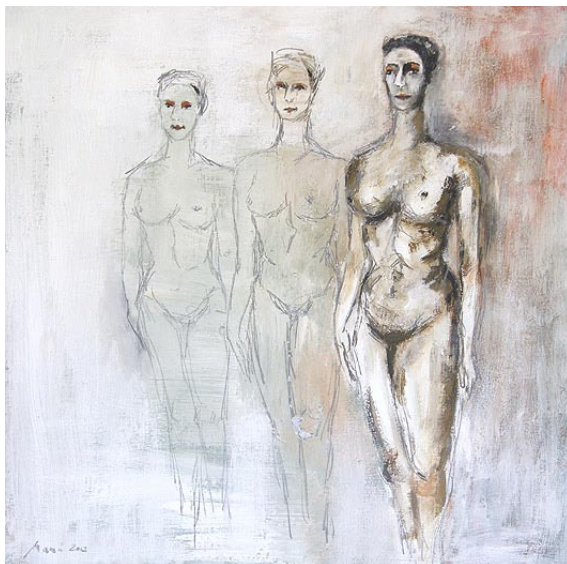
Marion Müller-Schroll »Schattenfrauen« Acryl auf Leinwand

Anmeldung erforderlich bei: regina. kemper@landtag. nrw.de