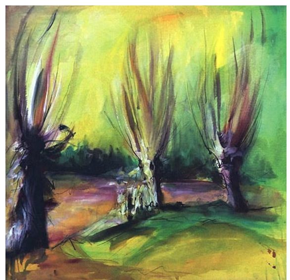
Mauga Houba-Hausherr »Weiden« Acryl auf Leinwand

„Alles ist Energie, alles ist in Bewegung. Unter unserem liebevollen Blick kann alles, auch das Unscheinbarste, Bedeutung erlangen.“