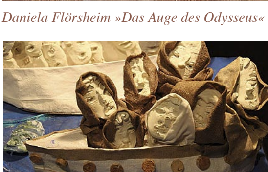
Karin Flörsheim »Travel of no Return«

THE BOX Duisburger Str. 97 40479 Düsseldorf 17. - 31. 5. 2013