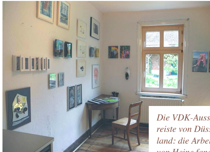
Die VDK-Ausstellung »voyage« reiste von Düsseldorf ins Wendland: die Arbeiten nach Texten von Heine fanden viel Interesse.